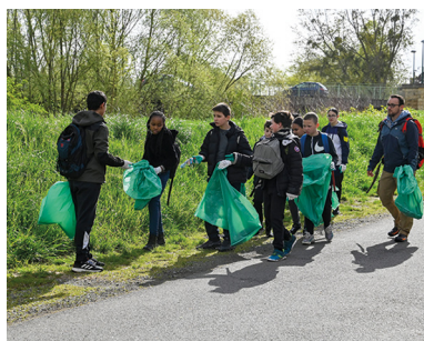
Opération de nettoyage du site Île Marie à Vierzon