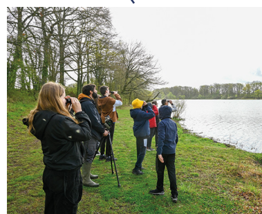
Découverte des espèces d'oiseaux Étang de Goule à Bessais-le-Fromental