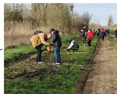
Plantation de jeunes saules Marais de Contres à Dun-sur-Auron