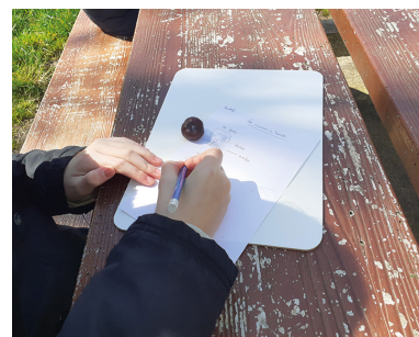
Initiation au dessin botanique Marais boisé du Val d'Auron à Bourges