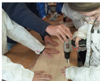
Construction de gîtes à mustélidés Bocage de Noirlac à Bruère-Allichamps